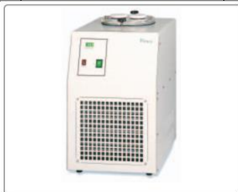
Cold Trap Baths