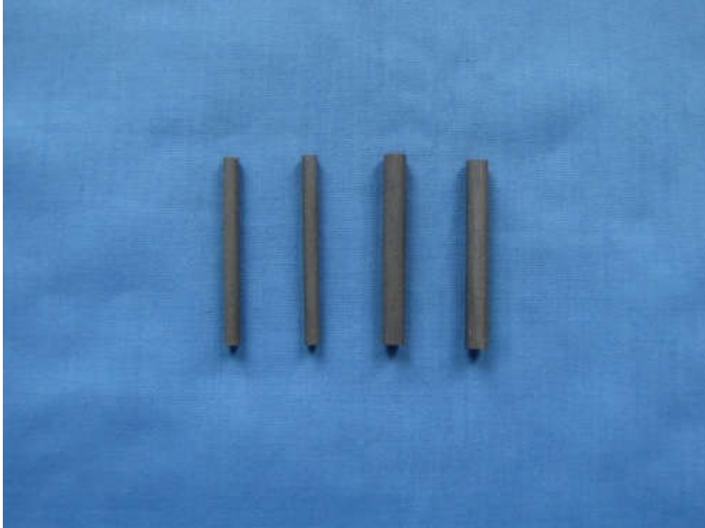
Graphite rod, diameter 4mm/6mm optional, length 150mm

الکتروود کمکی یا کانتر الکتروود میله گرافیتی با قطر ۴ میلی متر و طول ۱۵۰ میلیمتر