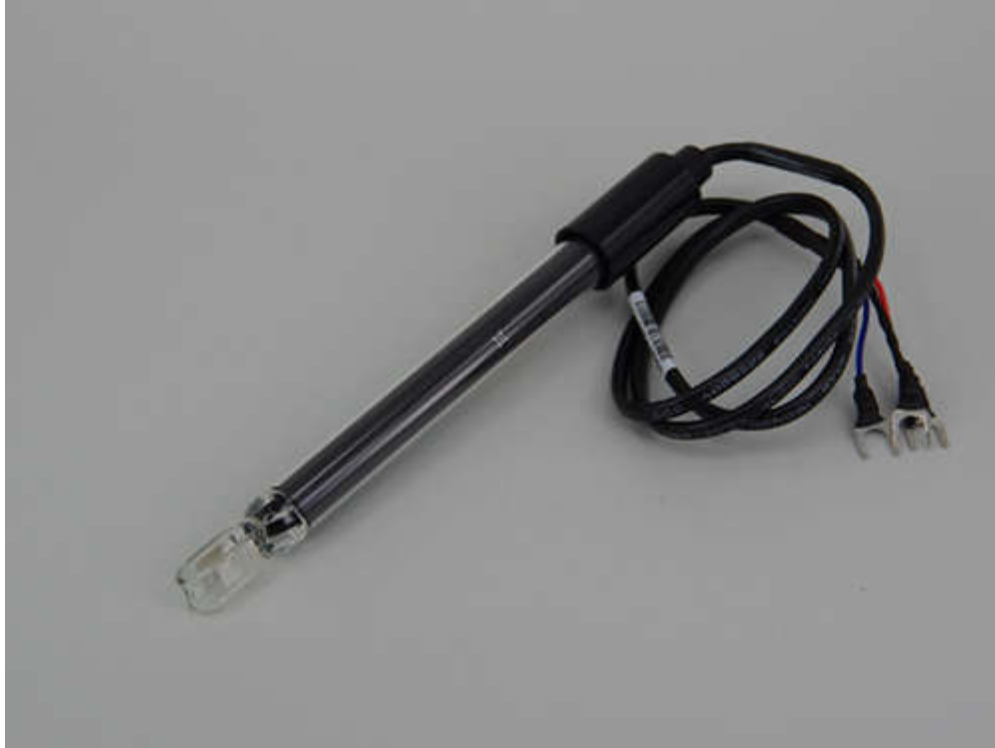
CS910 Pt conductivity electrode