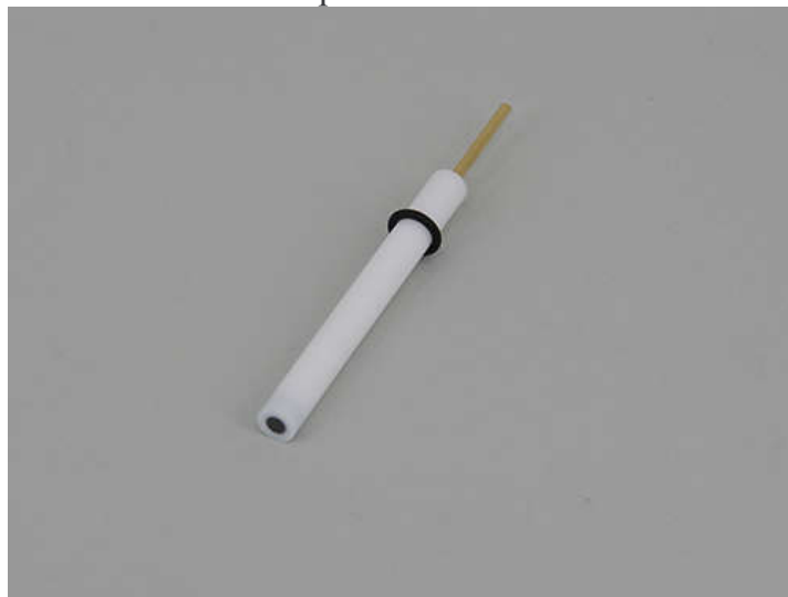
PTFE sleeve, \phi 2mm~5mm diameter optional