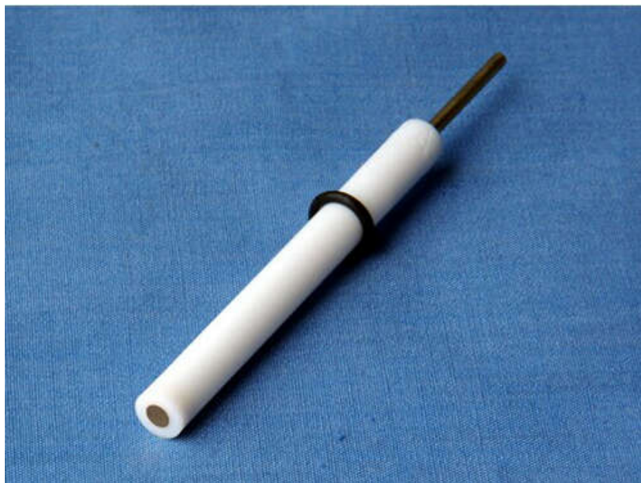
Gold working electrode, disc dia. 2mm/3mm optional