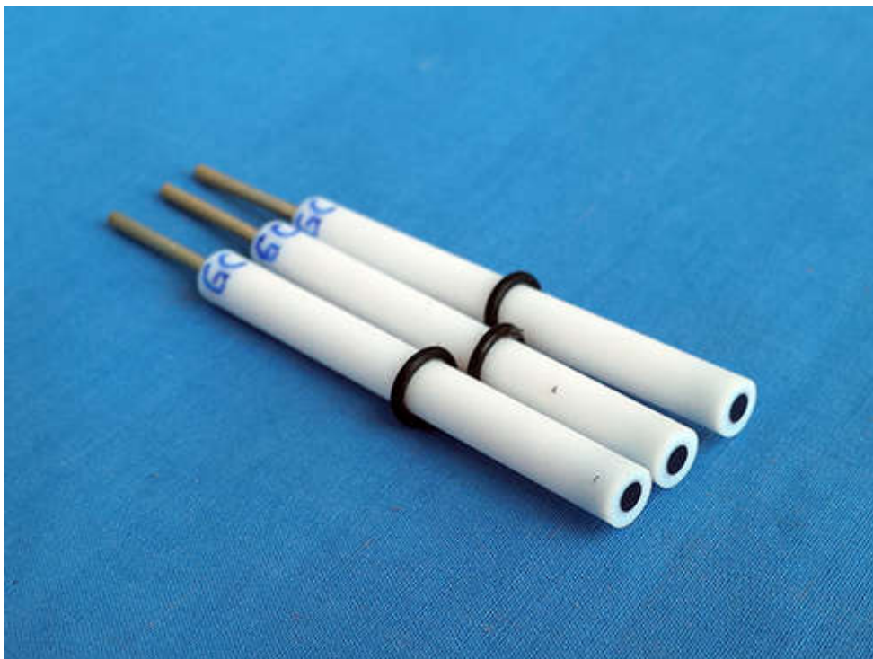
CS920 GC Working electrode, diameter 2mm/3mm/4mm/5mm optional