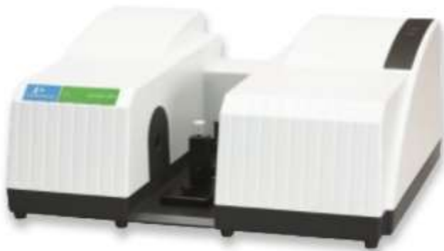
اسپکتروفتومتر UV-Visible مدل LAMBDA 465

اسپکتروفتومتر UV-Vis مدل LAMBDA 465، محصول شرکت PerkinElmer، کشور آمریکا می باشد. اسپکترومتر مرئی-ماوراءبنفش مدل LAMBDA 465 با قابلیت استفاده ساده، مقرون به صرفه، دارای سیستم UV / Vis تک پرتویی و با قابلیت جمع آوری داده ها و حداکثر قابلیت اطمینان می باشد. اسپکتروسکوپی UV-Visible مدل LAMBDA 465 سیستمی مناسب برای محدوده گسترده ای از آزمایشگاه های محیط زیست و R&D می باشد که تجزیه و تحلیل های متداول را انجام می دهد. آشکارساز فوتودیود (PDA) اسپکتروفتومتر UV-Vis را قادر می سازد تا داده ها را به طور همزمان در سراسر طول موج کامل از ۱۹۰ نانومتر تا ۱۱۰۰ نانومتر شناسایی کند. پردازش کامل داده ها در کمتر از سه ثانیه توسط اسپکتروفتومتر UV-Vis مدل LAMBDA 465 صورت میگیرد. علاوه بر آن، طراحی مدولار طیف سنج مرئی-فرابنفش مدل LAMBDA 465 بدون هیچ بخش متحرکی، برای استفاده در هر آزمایشگاه ایده آل می باشد.