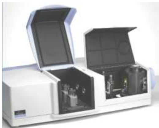
محصولات اسپکتروسکوپی LAMBDA 950/850/650

محفظه نمونه دوگانه در محصولات اسپکترومتر UV-Vis سری LAMBDA 950/850/650 بزرگترین در صنعت می باشد. محفظه اولیه برای محدوده وسیعی از لوازم جانبی بازتاب انتقالی استاندارد و قطبی کننده ها استفاده می شود. در حالیکه محفظه دوم می تواند توسط تعدادی ماژول هوشمند نمونه برداری سفارشی شود. محفظه نمونه شامل یکپارچه ساز کروی و اپتیک های انتقالی URA می باشد.