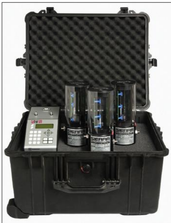
CalTrak Base with Three Flow Cells