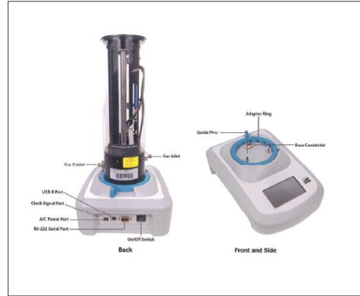
CalTrak 800 Back and Front View