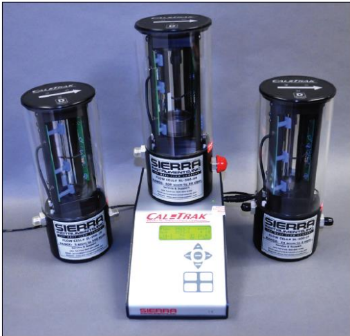
CalTrak Base with Three Flow Cells