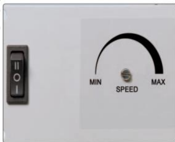
Fan Speed Adjuster