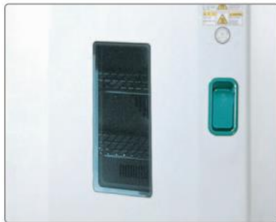
Tempered Viewing Windows